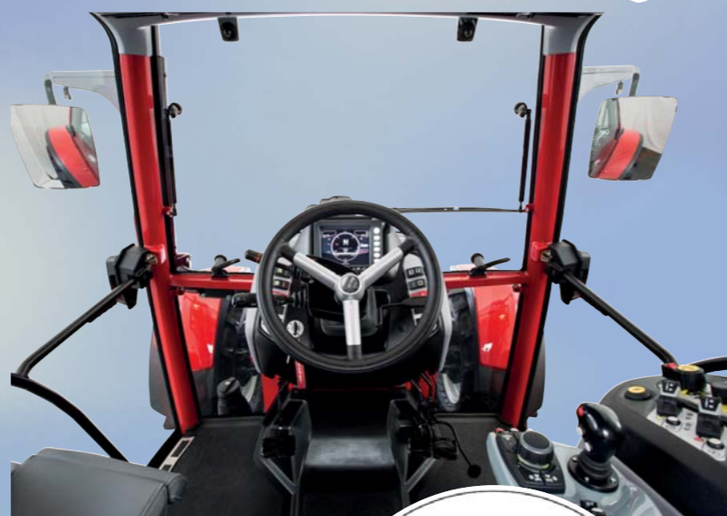
Er hat durch Hinterachslenkung nur 7 Meter Wenderadius

Wer im Erzgebirge lebt und arbeitet, der muss sich auf die Berge einstellen. Da ist das Laufen und das Fahrradfahren herrlich, wenn es runter geht, und anstrengend, wenn der nächste Hügel oder Anstieg wartet. Aber es ist hier im südlichen Sachsen besonders schön. Und das zu jeder Jahreszeit! Auch die Landwirtschaft arbeitet hier im Mittelgebirge unter diesen besonderen Bedingungen. Das liegt auch am Wetter: hier in den Bergen gibt es mehr Niederschläge und die Temperaturen sind im