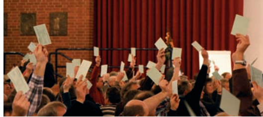
100% stimmten mit Ja.