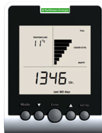
Beispielansicht: Verbrauch (in Liter) des letzten Jahres