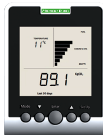
Beispielansicht: CO 2 - Ausstoß der letzten 30 Tage