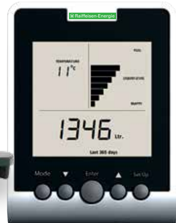
Beispielansicht: Verbrauch (in Liter) des letzten Jahres