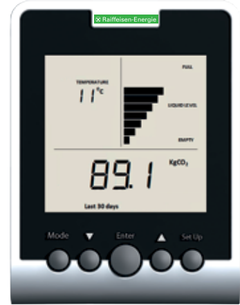
Beispielansicht: CO 2 - Ausstoß der letzten 30 Tage