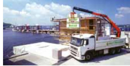
Energie und Baustoffe