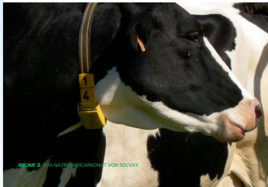
BICAR® Z DAS NATRIUMBICARBONAT VON SOLVAY